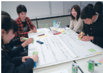
グループワークの様子