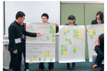
アイデアを発表を行う参加者