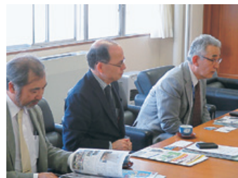
岩手大学の取組みを説明する 岩渕明学長（右）と八代仁副学長（中央）

「地方創生」が重要なキーワードとなっている現在、岩手大学では三陸沿岸地域との産学官連携を一層加速するとともに、地域が求める人材養成を行い、三陸沿岸地域への就職率向上を目指していきます。