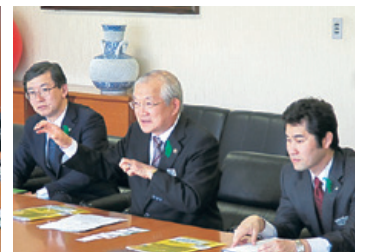
大船渡市の復興状況を説明する 戸田明大船渡市長（中央）