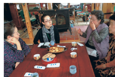
手仕事の合間に調査者とお茶飲み話をする

今後復興過程における被災者の実践について、その意味や社会的・文化的な文脈を含めた詳細な記録を目指し、調査を継続して行く予定です。