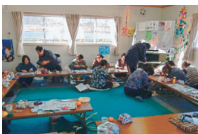
月2回、仮設団地内の集会所で活動する女性たち